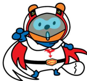
ガッチャマンポンタ