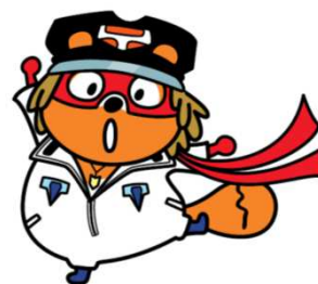
ヤッターマンポンタ